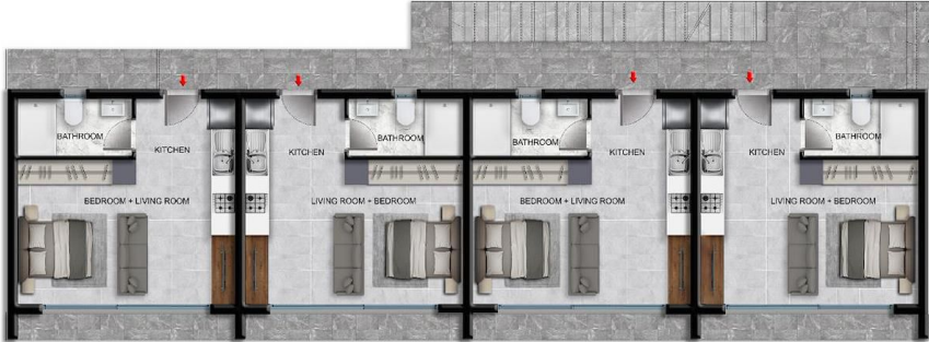
1ST FLOOR PLAN