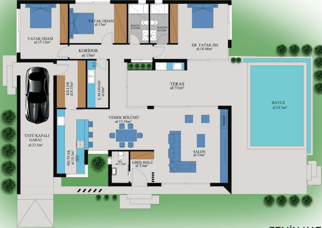
ZEMİN KAT PLANI 208 m²