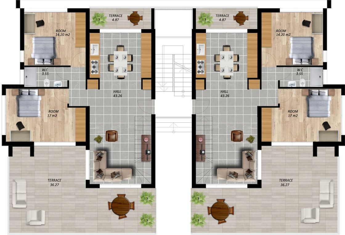
TYPE C FIRST FLOOR PLAN