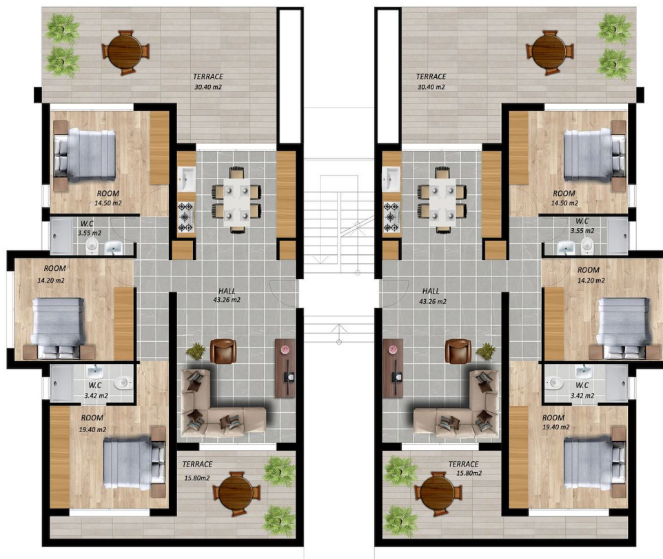
TYPE C GROUND FLOOR PLAN