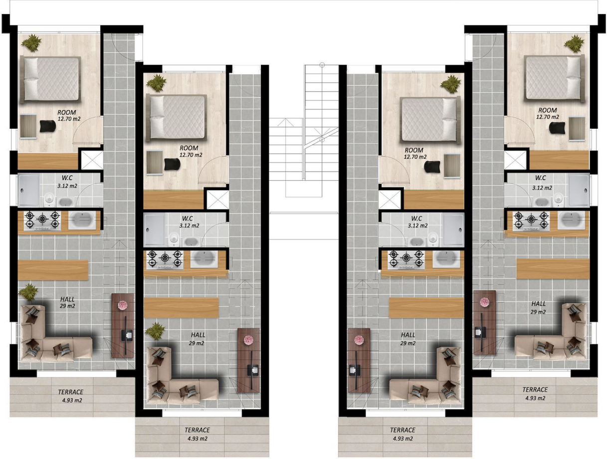
TYPE A FIRST FLOOR PLAN