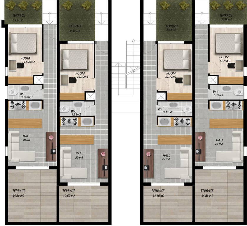
TYPE A GROUND FLOOR