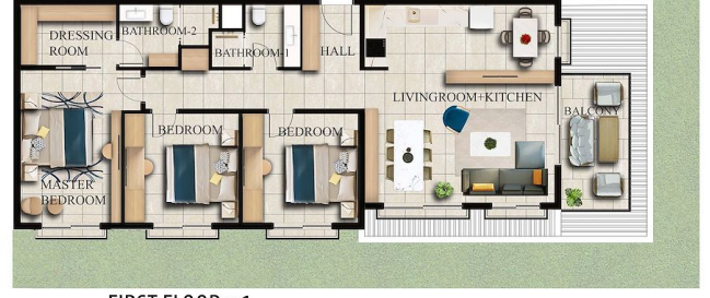
FIRST FLOOR x 1