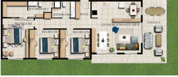
GARDEN FLOOR x 1