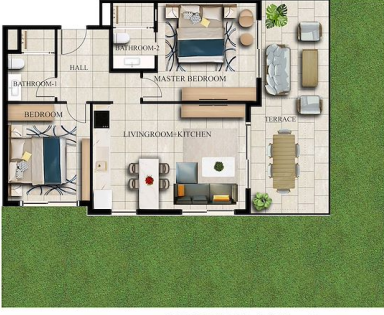
GARDEN FLOOR x 2