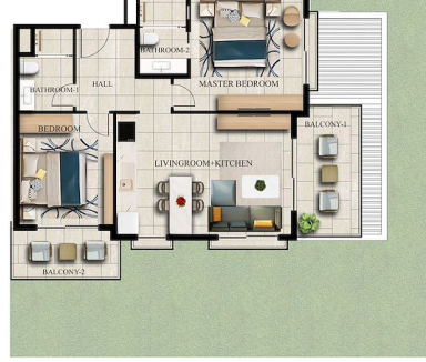
FIRST FLOOR x 2