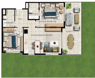
GARDEN FLOOR x 2