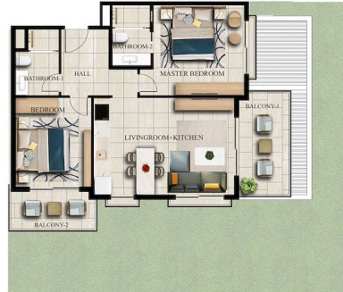
FIRST FLOOR x 2