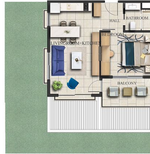
FIRST FLOOR x 70