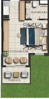
GARDEN FLOOR x 67