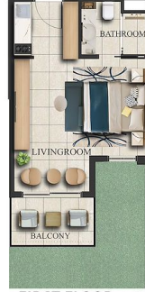
FIRST FLOOR x 67