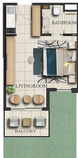
FIRST FLOOR x 67