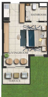
GARDEN FLOOR x 67