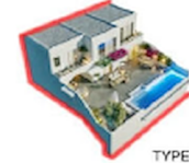
TYPE - C