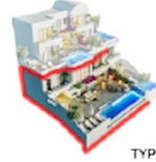
TYPE - A