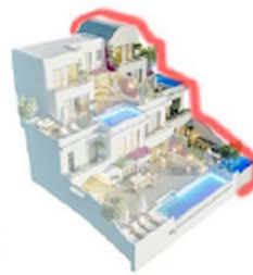
TYPE - A