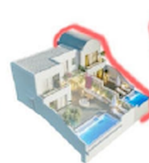
TYPE - B