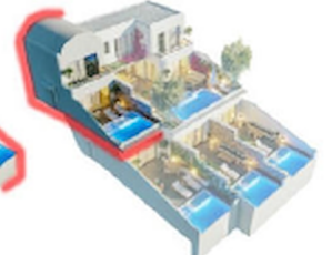
TYPE - E