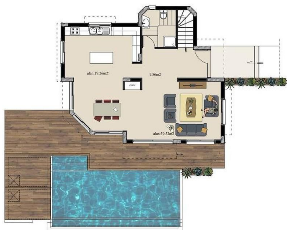
Zemin Kat Planı - Ground Floor Plan Alan - Area: 104 m 2