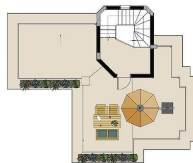
Çatı Katı Planı - Roof Floor Plan Kapalı Alan - Closed Area: 20 m 2