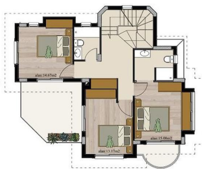
Birinci Kat Planı - First Floor Plan Alan - Area: 86,40 m 2