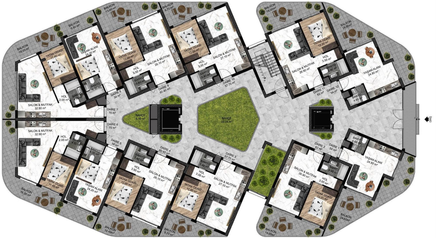
BLOK 6 ZEMİN KAT PLANI