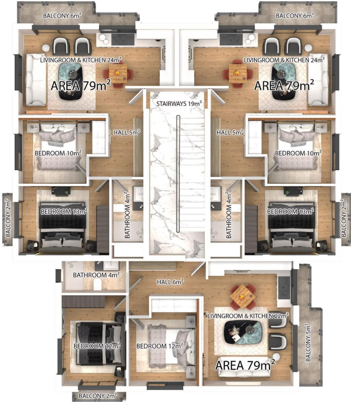
A BLOCK 1st & 2nd FLOOR PLAN