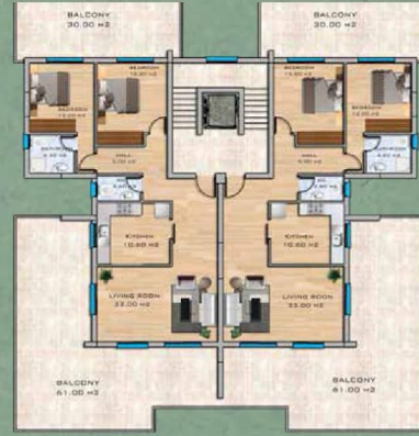
Penthouse Floor Plan