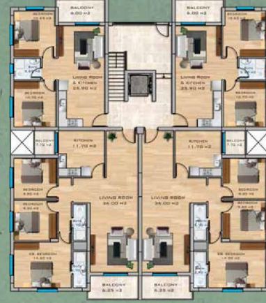
2+1, 3+1 Apartments Ground Floor Plan