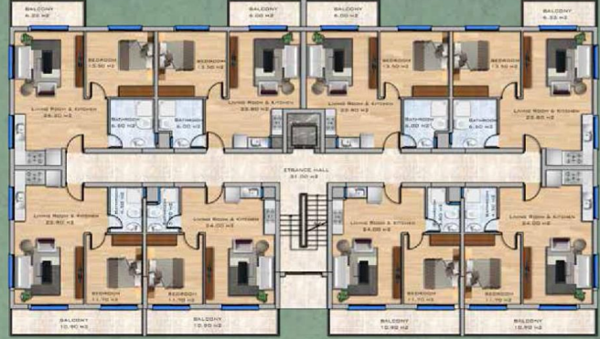
1+1 Apartments First Floor Plan