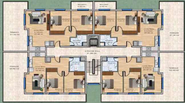
Penthouse Floor Plan