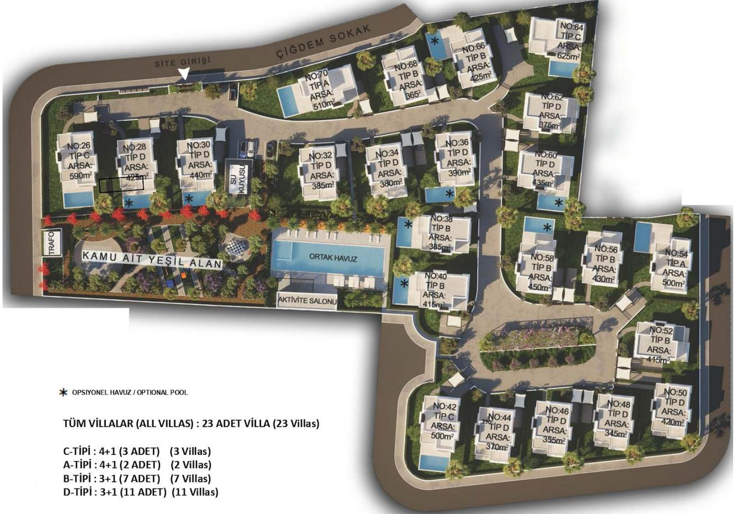
VAZİYET PLANI – LAYOUT PLAN