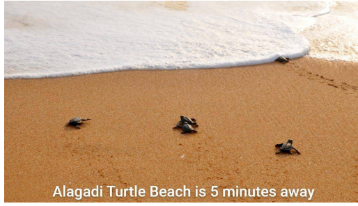
Alagadi Turtle Beach is 5 minutes away