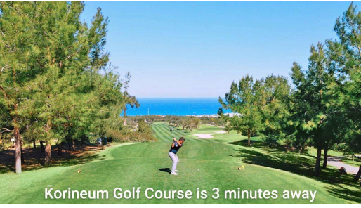
Korineum Golf Course is 3 minutes away